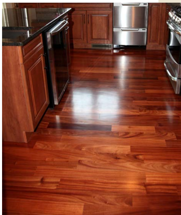
Revêtement de sol dans une cuisine – Brenco Exotic Woods (États-Unis).