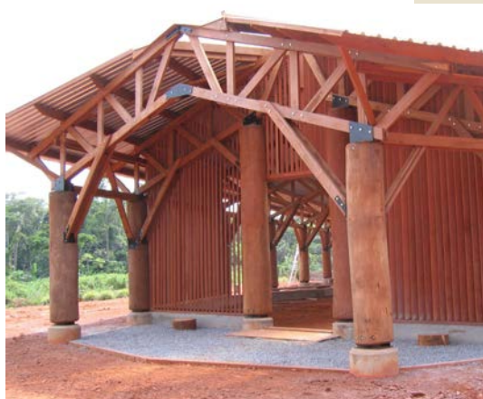
Poteaux en Tali (diamètre 0,6 m, longueur 8,5 m), charpente en Kosipo, bardage à claire-voie en Mukulungu – Réalisation J.Y. Riaux, Mindourou (Cameroun).